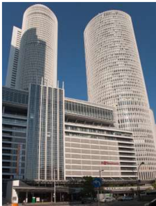
Рис. 2. Вокзал в Нагое