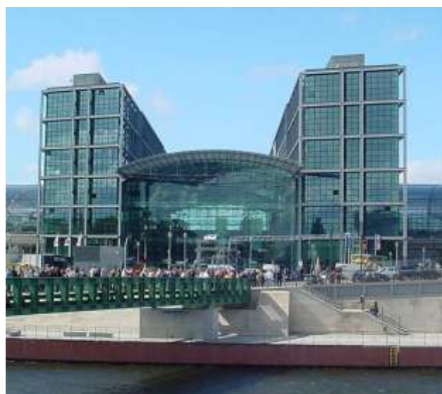
Рис. 4. Вокзал Берлин Центральный

Транспортный фактор определяет сочетание видов транспорта, пересекающихся в транспортном узле. Наиболее перспективным направлением является мультимодальность – сочетание железнодорожного, авто- и авиатранспорта с внутренним городским авто-, вело- и