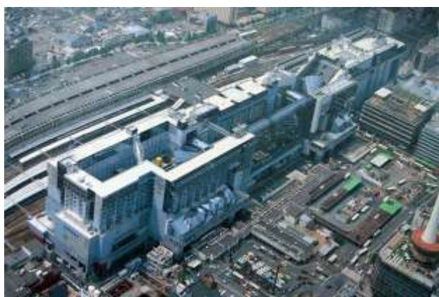
Рис. 3. Вокзал в Киото