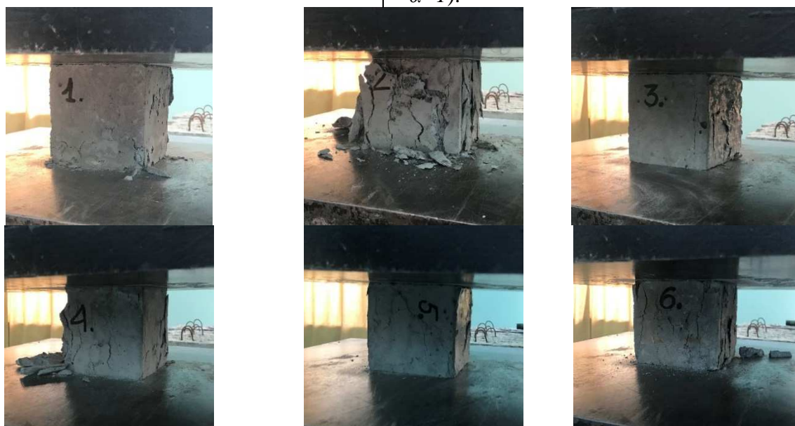
Рис. 6. Стандартні випробування з визначення кубикової міцності бетону на стиск у пресі ПСУ-250

де N – руйнівне навантаження, кН; A_c – площа робочого перерізу зразка, мм 2 ; \alpha – масштабний коефіцієнт для приведення міцності зразка до міцності бетону базового розміру та форми (для куба 100x100x100 \alpha=1 ).