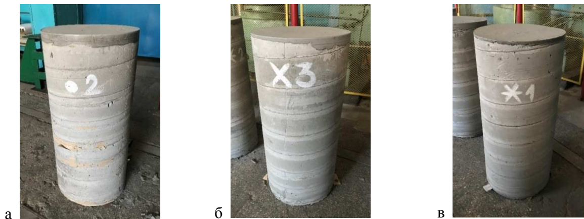
Рис. 5. Маркування серій зразків: а – бетонний зразок серії БС-0 (• 1-3); б – бетонний зразок з обіймою серії БС-П (X 1-3); в – бетонний зразок з обіймою і шпангоутами серії БС-ПШ (Ж 1-3)

Перед проведенням циклу експериментальних досліджень виконані стандартні випробування матеріалів конструктиву, зокрема, визначення кубикової міцності бетону.