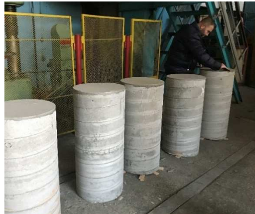
Рис. 3. Загальний вигляд бетонних зразків до (зліва) та після (справа) видалення картонної опалубки

Дослідний зразок, в загальному випадку, являє собою коротку бетонну колону висотою близько 1000 мм та діаметром 450 мм. Серед забетонуваних колон виокремлено три серії зразків: БС-0 – суто бетонні стійки (рис. 4, а); БС-П – бетонні колони з сітчастою обоймою з просічно-витяжного листа (рис. 4, б); БС-ПШ – бетонні колони з обоймою з просічно-витяжного листа та додатково підкріплені арматурними шпангоутами (рис. 4, в). У кожній серії виготовлено по шість зразків.