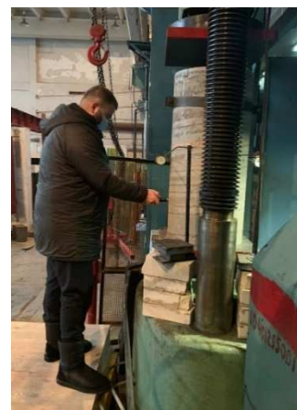
Рис. 7. Підготовка зразків до випробувань