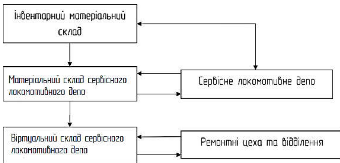
Рис. 3. Структурна схема обороту запасних частин

У зв'язку з цим виникає необхідність створення центрального складу на базі одного з сервісних локомотивних депо для групи сервісних локомотивних депо в 12–24-годинній доступності. Це все дасть змогу скоротити номенклатуру матеріального складу сервісного локомотивного депо, а дорогі вузли і агрегати зосередити на центральному матеріальному складі. Схему обороту запасних частин подано на рис. 3