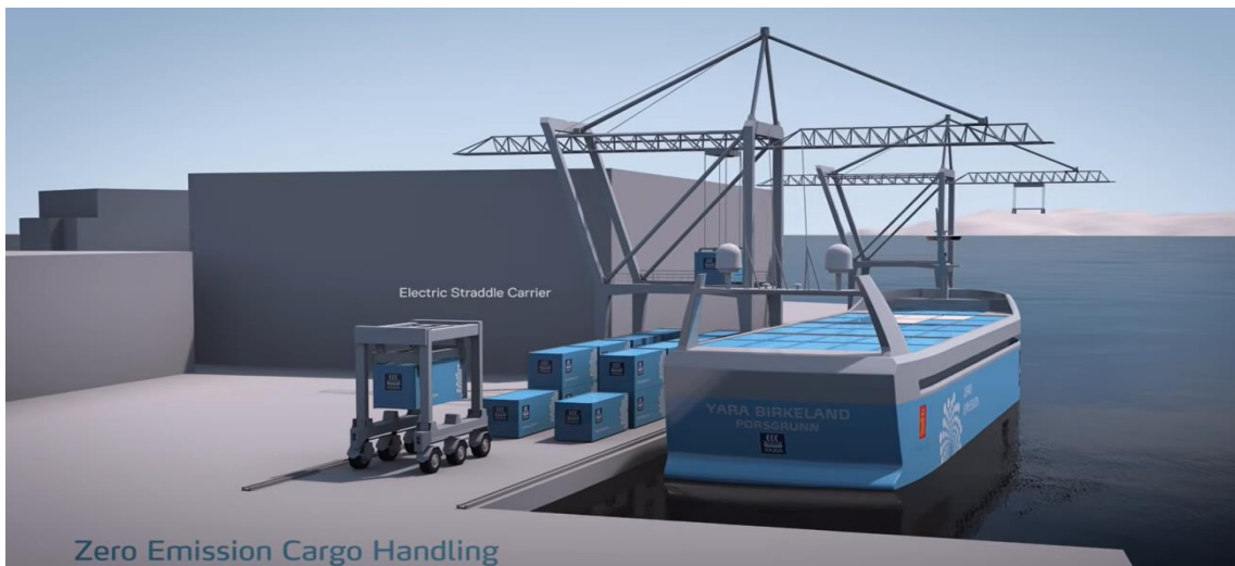
Рис. 1. Проект автономного контейнеровозу і терміналу від компаній Yara International і Kongsberg Group [8]