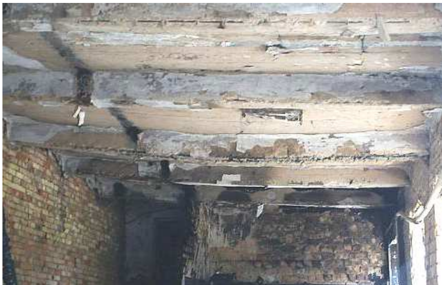
Рис. 2. Вигляд тріщин у місцях спирання балок на стіну по ряду 7

➤ деструктивні ділянки у залізобетонній плиті перекриття на стелі першого поверху.