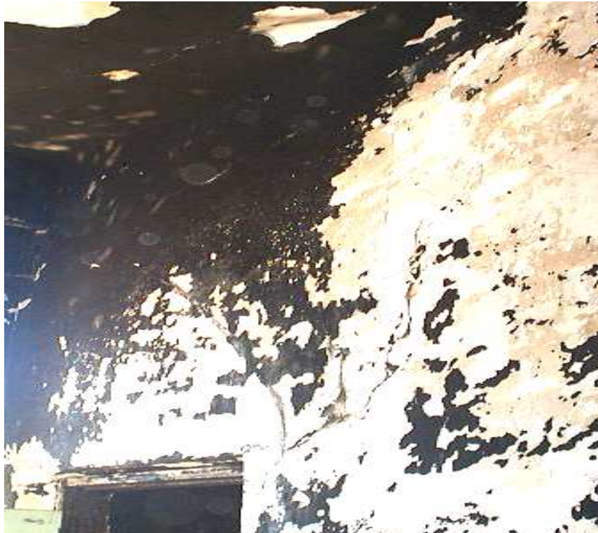
Рис. 5. Тріщини в поперечній стіні біля входу у приміщення другого поверху

➤ відстань між тріщинами на стелі першого поверху – 750 мм і 1500 мм; ширина розкриття тріщин – 1,5-2 мм.