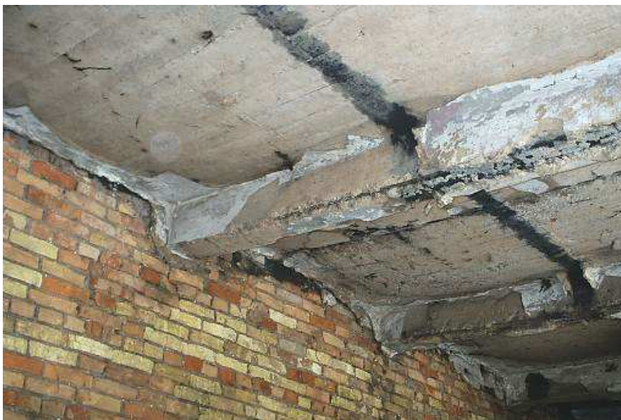
Рис. 3. Тріщини в місцях спирання балок на стіни