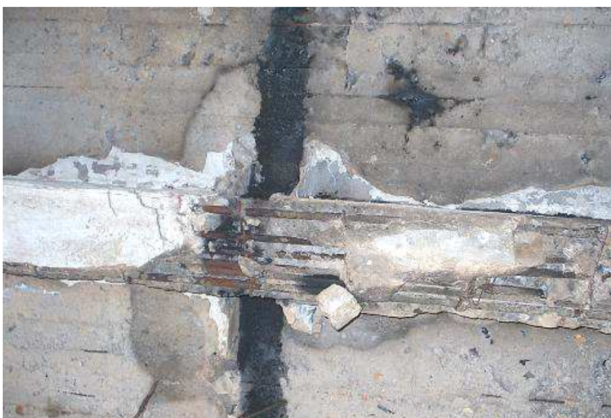
Рис. 4. Порушення захисного шару бетону із оголенням робочої арматури

Інструментальне обстеження проводилося з метою збору інформації для остаточної оцінки технічного стану конструкцій. Під час інструментального обстеження стану будівельних конструкцій використовувалися лінійка вимірвальна (ГОСТ 427-75), штангенциркуль (ГОСТ 166-89), прилад ультразвуковий УК-14ПМ.