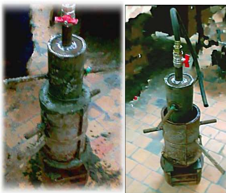
Рис. 1. Разработанная установка для изготовления бетонных цилиндров с полым сечением способом вибровакуумирования