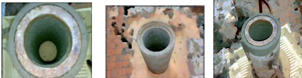
Рис. 2. Полученные образцы бетонных цилиндров с полым сечением

Данные экспериментов показали, что прочность при растяжении вибровакуумных бетонных цилиндров на 40 % выше, чем у цилиндров, полученных послойным осевым прессованием и вибрированием.