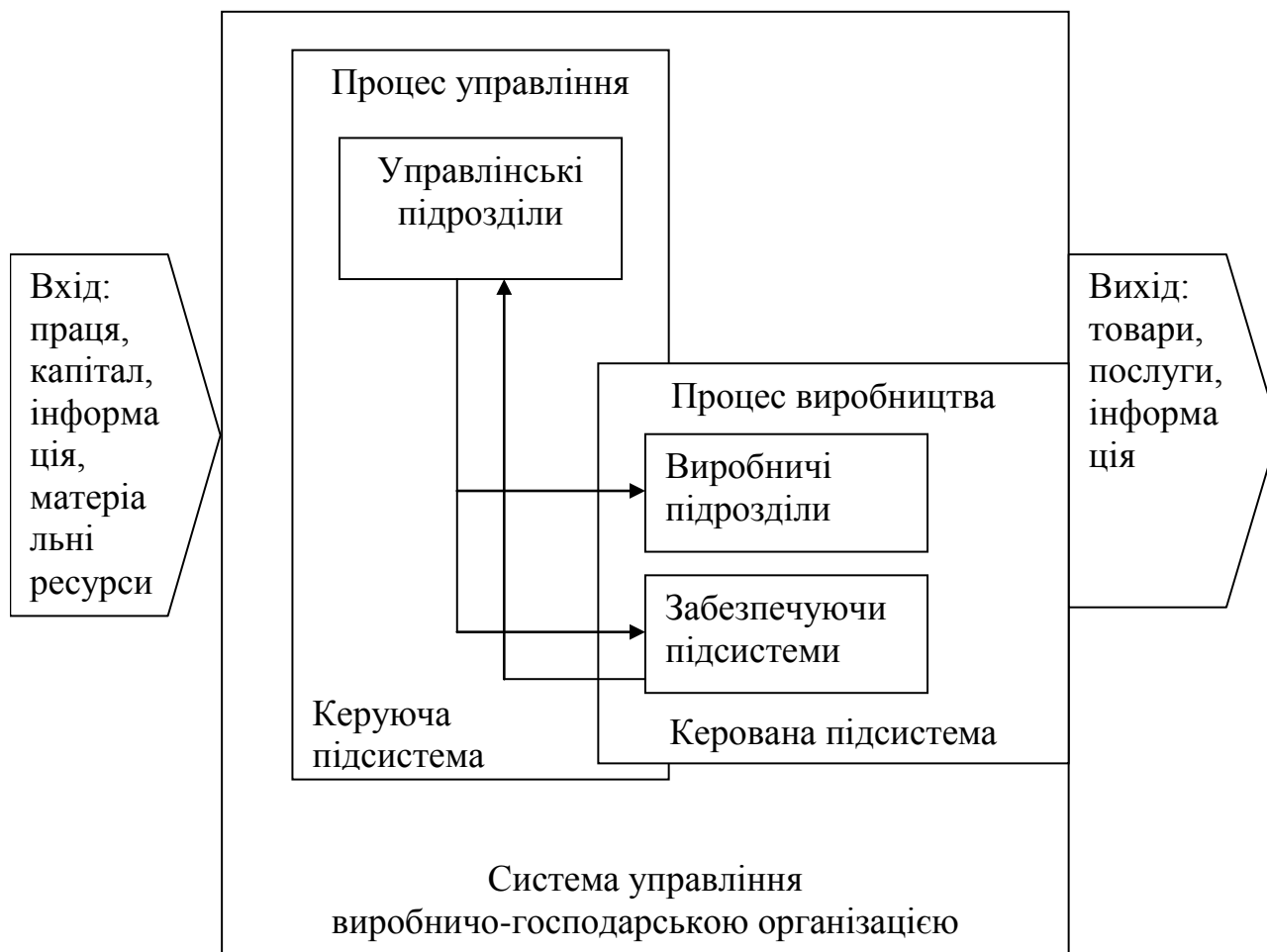
Рис. 3. Структура системи управління організацією

Виходи системи управління – це елементи системи управління, через які інформація та продукт функціонування виробничо-господарської організації надходять у навколишнє середовище.