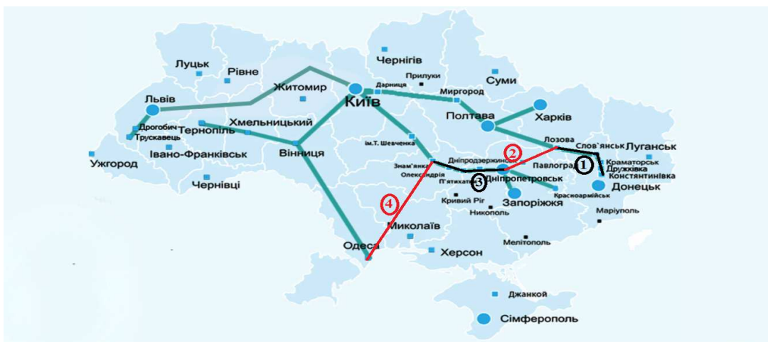
Рис. 1. Географічний розподіл магістралі на чотири ділянки

- Знам'янка-Пас. - Одеса Головна → ділянка 4 - (необхідна модернізація – 408 км).