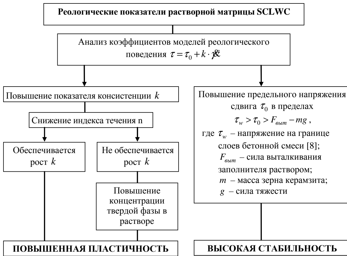
Рис. 1. Схема зависимости технологичности от реологических показателей растворной матрицы SCLWC

Балансируя между этими показателями коэффициента k и \tau_0 , теоретически является возможным получить самоуплотняющуюся бетонную смесь на легком заполнителе с обеспечением его подвижности и однородности.