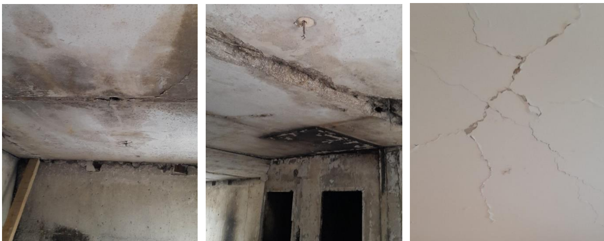
Рис. 5. Фотофіксація панелей перекриттів зі ступенем пошкодження 2

кутах на глибину трохи більше 20 мм. На поверхні розтягнутої зони бетону видно сітку неглибоких температурно-збіжних тріщин шириною розкриття до 1 мм. Прогин плити не перевищує нормативний.