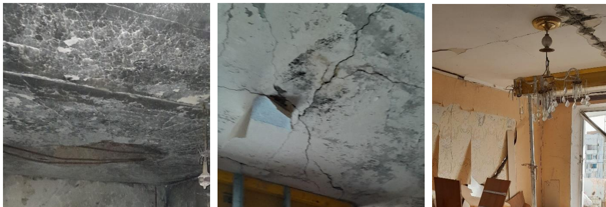
Рис. 6. Фотофіксація панелей перекриттів зі ступенем пошкодження 3

Четвертий ступінь (рис. 7) – аварійний стан конструкції. Тріщини шириною розкриття 3-5 мм, оголення робочої арматури, тріщини в стиснутій та опорній зоні. Прогини перевищують 1/50 прольоту, що спричинено плинністю арматури.