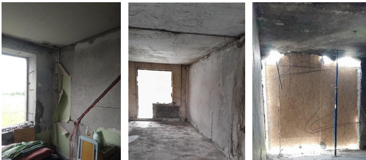
Рис. 4. Фотофіксація панелей перекриттів зі ступенем пошкодження 1

до 15 %. Міцність бетону відповідає проектній. Зміна кольору за впливу пожежі незначна – сажа та кіптява на поверхнях. При простукуванні молотком захисний шар відколюється по кутах на глибину трохи більше 10 мм. Волосяні тріщини на поверхні бетону вздовж робочої арматури. Локальні пошкодження захисного шару арматури.