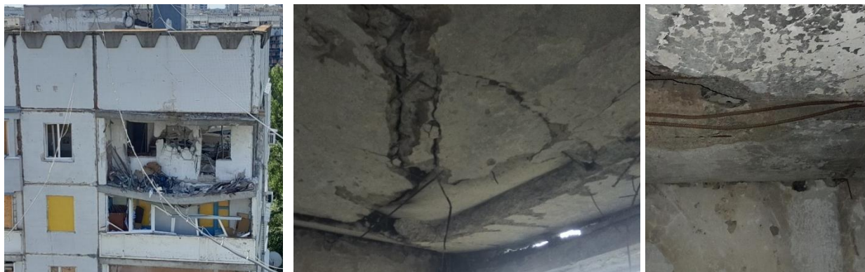
Рис. 7. Фотофіксація панелей перекриттів зі ступенем пошкодження 4

П'ятий ступінь (рис. 8) – повна втрата несучої здатності, обумовлена втратою стійкості, роздавлюванням бетону, порушенням анкерування, оголенням і розривом робочої арматури.