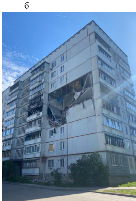
Рис. 1. Приклади руйнування панельної забудови міста Харків: а – обвалення несучих конструкцій будівлі від рівня покрівлі до фундаментів; б – руйнування несучих конструкцій 4-6 поверхів