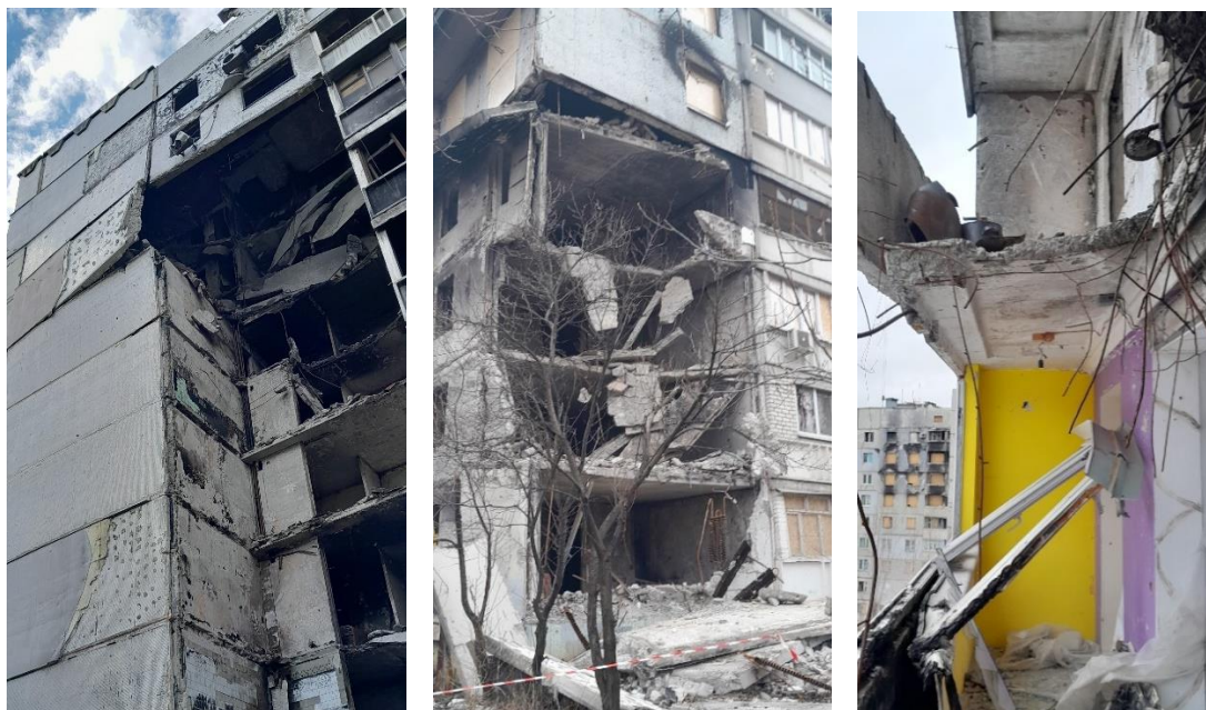
Рис. 8. Фотофіксація панелей перекриттів зі ступенем пошкодження 5