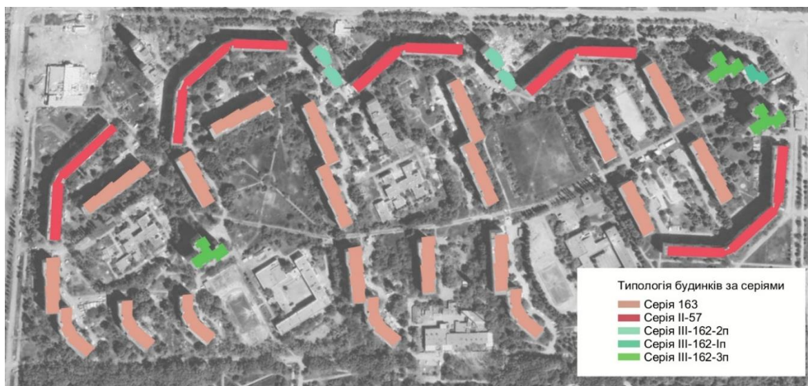
Рис. 3. Типологія будинків Північної Салтівки 3 за типовими серіями [16]

Ступінь пошкодження згаданих будинків відрізняється. Лише на декількох будинках можна помітити вибиті вибуховою хвилею вікна або посічені осколками фасади, більшість же будівель зазнали прямих влучань об'єктів ураження, у результаті чого зруйновані окремі поверхи, під'їзди та цілі секції, як було раніше показано на рис. 1. Отже, і ступінь пошкодження панелей перекриттів також варіюється.