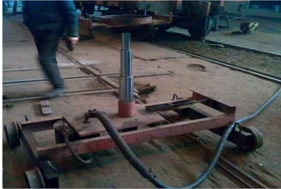
Рисунок – 1 Пристрій для демонтажу і вивозу п'ятника з-під вагону

на циліндрі на інший бік п'ятника, зрізуються дві заклепки, які знаходяться далі від п'ятника. В останню чергу зрізують заклепки, які ближче до п'ятника. Після чого двигун вимикається, випускається повітря з циліндру і платформа разом з п'ятником опускається. Далі пристрій викачується з-під вагону.