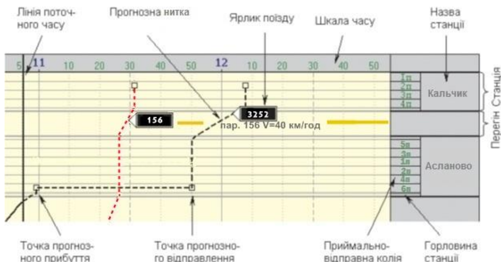
Рис. 2. Приклад інтерфейсу виконаного ГРП на АРМ ДНЦ

Розраховані в залежності від різних швидкостей руху прогнози нитки ГРП запропоновано відобразити у вигляді інтерфейсу ГРП на АРМ ДНЦ, як показано на рис. 2.