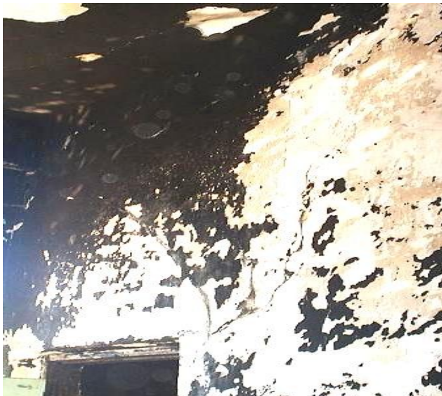
Рис. 5. Тріщини в поперечній стіні біля входу у приміщення другого поверху

➤ відстань між тріщинами на стелі першого поверху – 750 мм і 1500 мм; ширина розкриття тріщин – 1,5-2 мм.