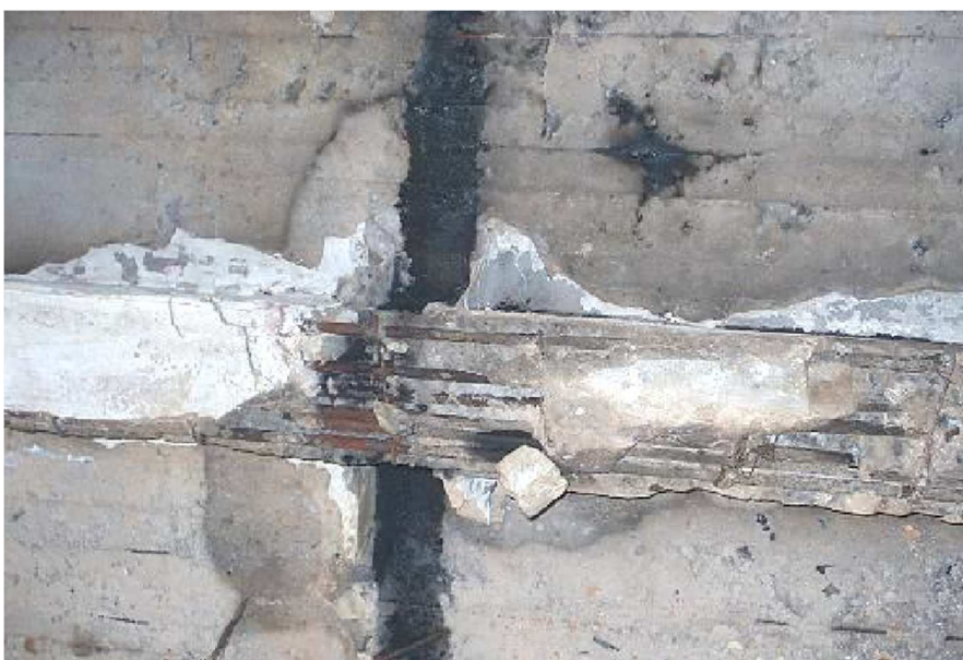
Рис. 4. Порушення захисного шару бетону із оголенням робочої арматури

Інструментальне обстеження проводилося з метою збору інформації для остаточної оцінки технічного стану конструкцій. Під час інструментального обстеження стану будівельних конструкцій використовувалися лінійка вимірвальна (ГОСТ 427-75), штангенциркуль (ГОСТ 166-89), прилад ультразвуковий УК-14ПМ.