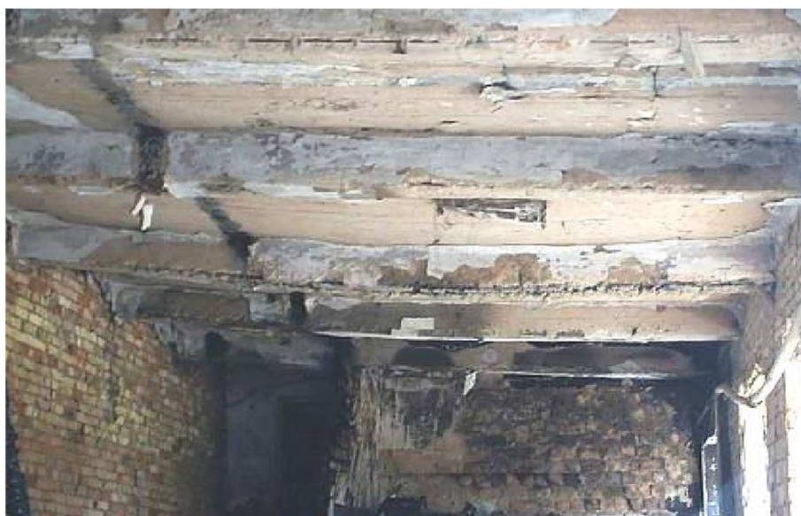
Рис. 2. Вигляд тріщин у місцях спирання балок на стіну по ряду 7

➤ деструктивні ділянки у залізобетонній плиті перекриття на стелі першого поверху.