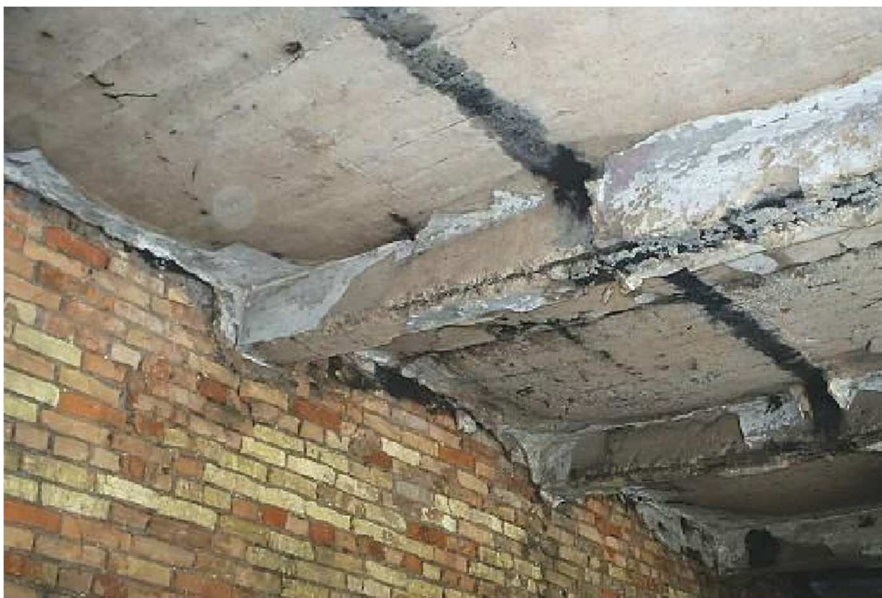
Рис. 3. Тріщини в місцях спирання балок на стіни