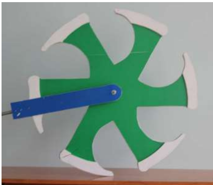
Рис. 5. Лабораторний образец шагающего колеса «тук-тук»

Увеличение длины шага шагающего режима по сравнению с длиной шага колесного режима приводит к увеличению величины отклонения центра ступицы \delta от прямолинейной траектории. При этом ударное приземление спиц становится ощутимым. И наоборот, увеличение длины шага колесного режима по сравнению с длиной шага шагающего режима приводит к уменьшению \delta . Колесо при этом катится легко и звук