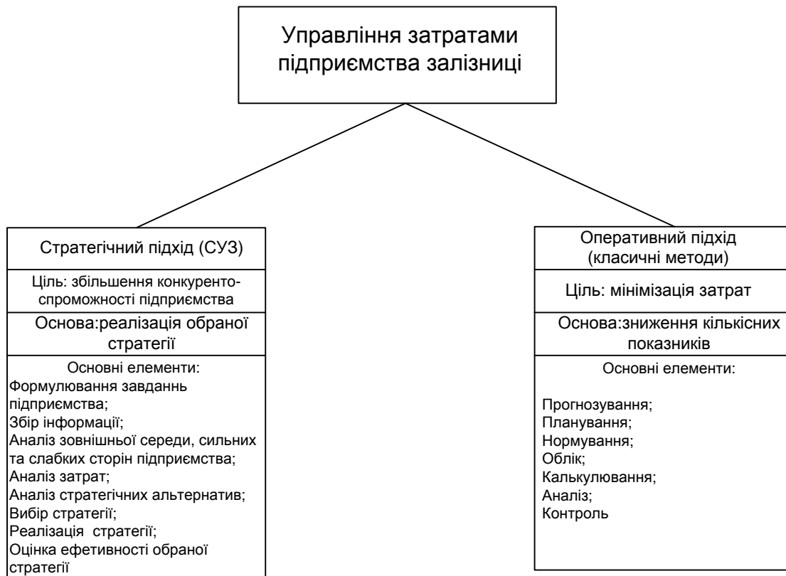
Рис. 1. Основні характеристики стратегічного й оперативного підходів до управління витратами на залізничному транспорті

Основна частина дослідження. Для створення повноцінної та ефективної системи управління витратами залізничного транспорту необхідно об'єднати два важливих підходи до управління витратами: стратегічний та оперативний, кожен з яких характеризується своїми цілями, принципами і методами (рис. 1).