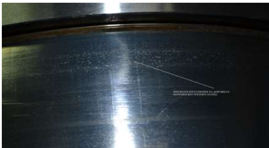
Рис. 2. Сліди луцення металу на доріжках кочення внутрішнього кільця

На підставі проведених випробувань визначено показники надійності циліндричних буксових підшипників (здвоєний). Нижня межа ймовірності безвідмовної роботи складатиме 0,889, а верхня – 1. Такий високий розбіг показників викликаний недостатньою кількістю об'єктів випробувань (лише 2 вагони та 16 здвоєних підшипників).