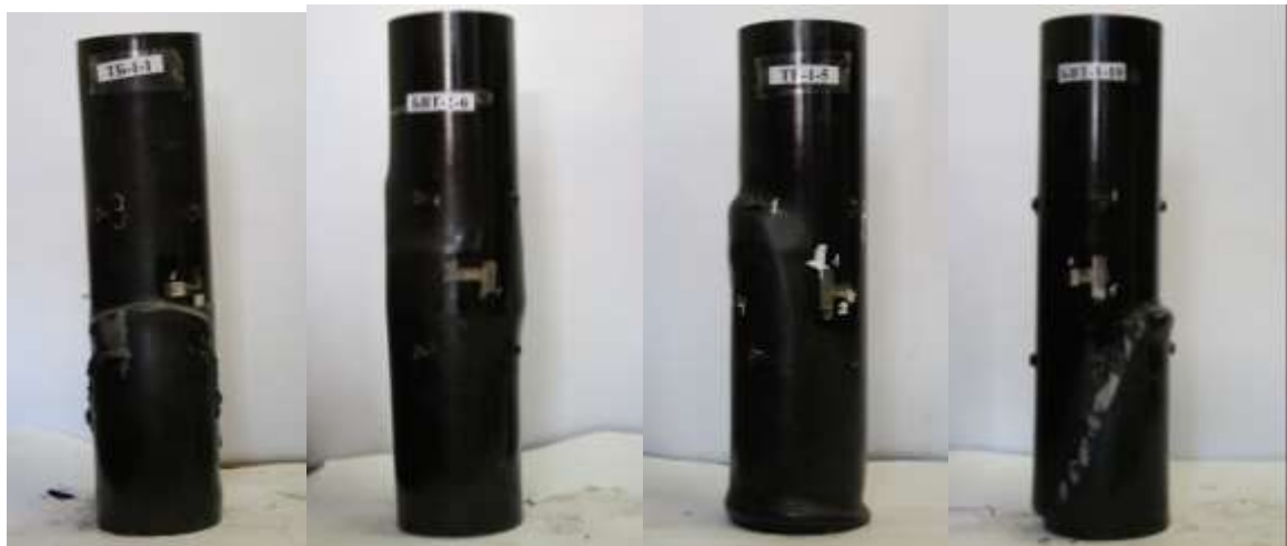
Рис. 1. Характер руйнування зразків

зусилля N_2 зразків, що характеризувалася утворенням і розвитком зрізів при зростанні навантаження під кутом 20-35°. Зразок ТБ-1-1 з складом бетону 1 зруйнувався внаслідок утворення поперечної гофри, а також розширення зразка у середньому перерізі. Зразки серії БВТ-1-6 з складом бетону 1 навантаження передавалося на бетонне ядро руйнувався внаслідок поперечного розширення в середині перерізу і на момент досягнення граничного стану не мав гофр.