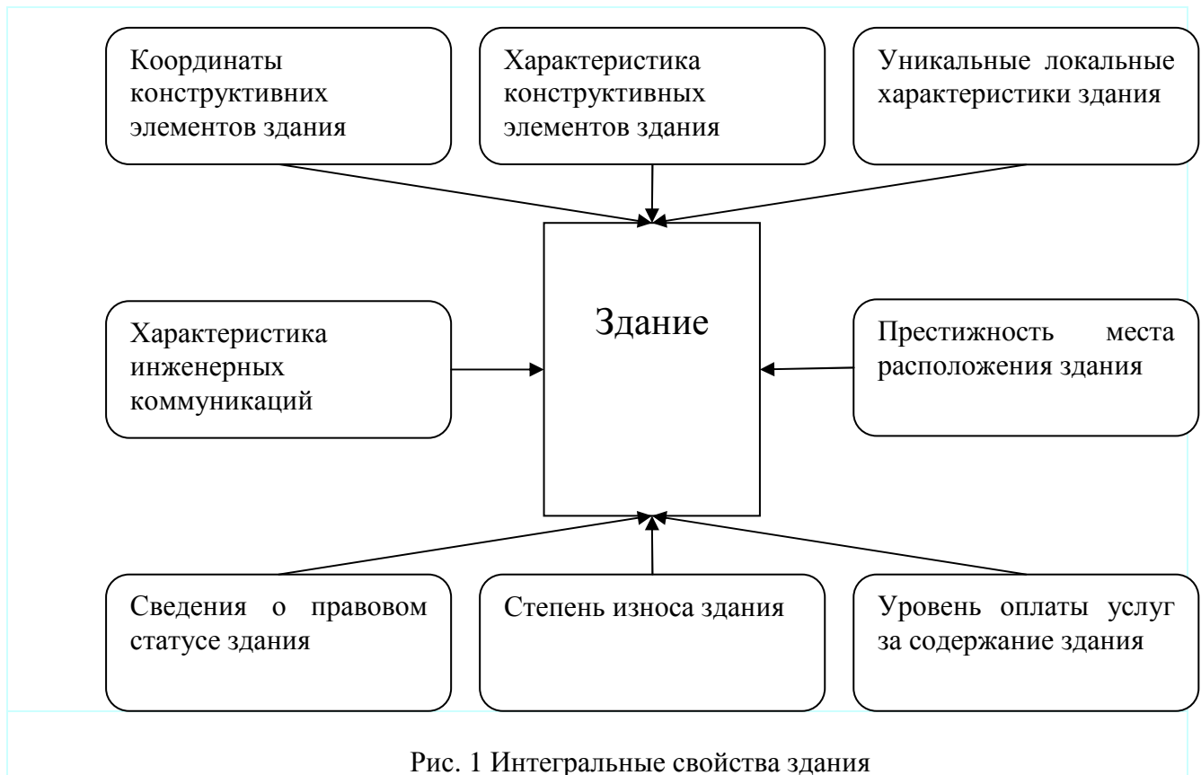
Рис. 1 Интегральные свойства здания

комплексное понятие включающее в себя иные факторы (рис. 1). технические, юридические, экономические и