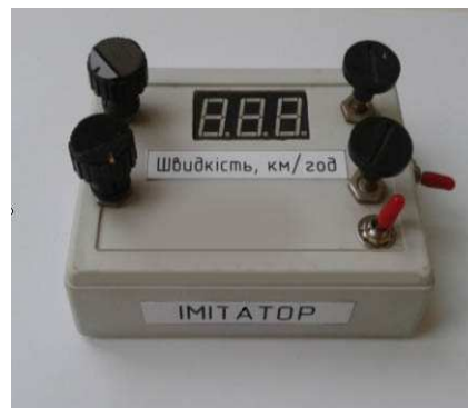
Рис. 1. Макетний зразок пристрою акустичного контролю та імітатор звука взаємодії колеса з рейкою