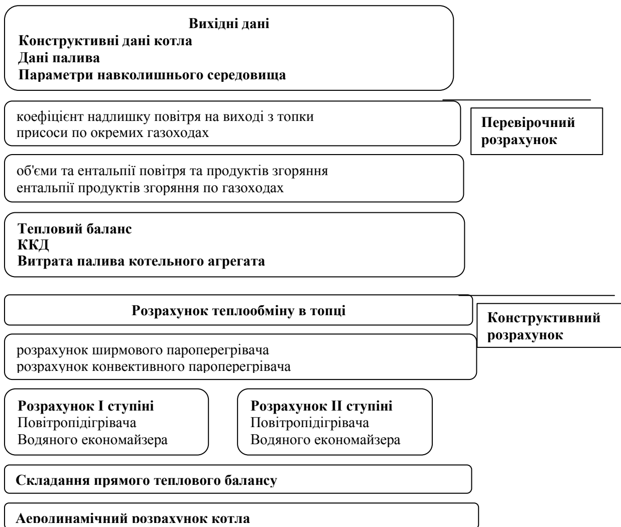
Рис. 1. Алгоритм розрахунку теплового балансу згідно з Нормативним методом

Методика теплового розрахунку котла, що наведена в Нормативному методі, включає перевірочний і конструктивний розрахунки котлів. Якщо виділити основні етапи розрахунків, то умовно можна їх поділити на наступні складові (рис. 1).